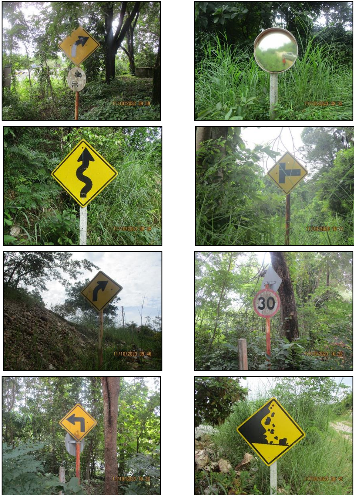
ภาพที่ 2.4 ป้ายจราจร และป้ายเตือนอันตรายภายในพื้นที่โครงการ