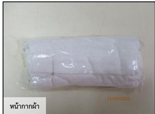
หน้ากากผ้า