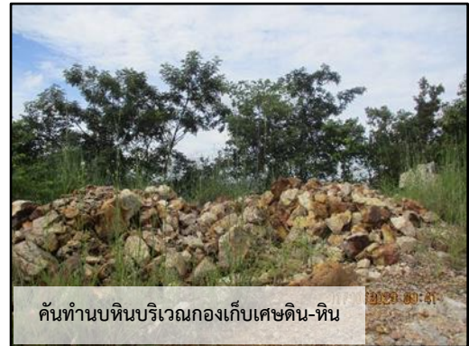
ภาพที่ 2.2 พื้นที่กองเก็บเศษดิน เศษหิน