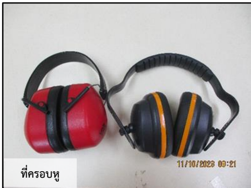
ที่ครอบหู