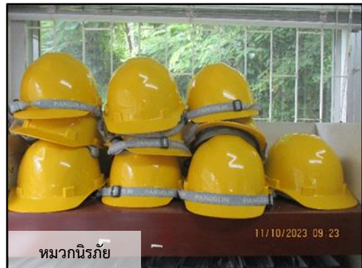
หมวกนิรภัย