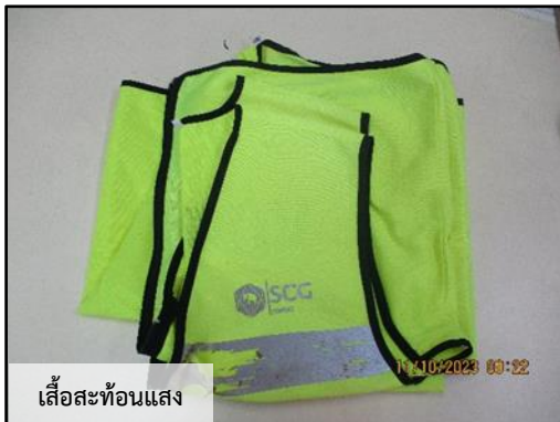
เสื้อสะท้อนแสง