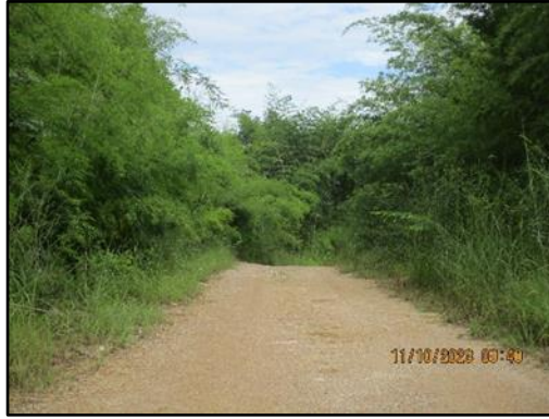
ภาพที่ 2.5 สภาพเส้นทางคมนาคมภายในพื้นที่โครงการ

รายงานผลการปฏิบัติตามมาตรการป้องกันและแก้ไขผลกระทบสิ่งแวดล้อมและมาตรการติดตามตรวจสอบผลกระทบสิ่งแวดล้อม โครงการเหมืองแร่โพไฟลด์ โดยวิธีเหมืองหาบ ประทานบัตรที่ 28058/15776 ของบริษัท ปูนซิเมนต์ไทย จำกัด (มหาชน) ระหว่างเดือนกรกฎาคม-ธันวาคม 2566