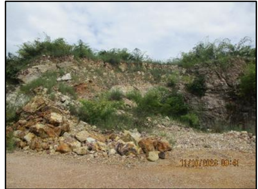
ภาพที่ 2.1 พื้นที่หน้าเหมืองในปัจจุบัน