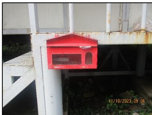
ภาพที่ 2.8 ตู้รับเรื่องร้องเรียนบริเวณหน้าเหมือง