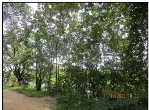
ภาพที่ 2.7 การปลูกต้นไม้โดยรอบพื้นที่โครงการ