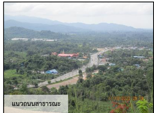
ภาพที่ 2.3 การเว้นระยะพื้นที่ไม่ทำเหมืองเข้าใกล้แนวถนนสาธารณะ